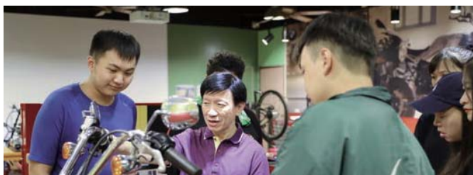
電動二輪車與哈雷重型機車實習