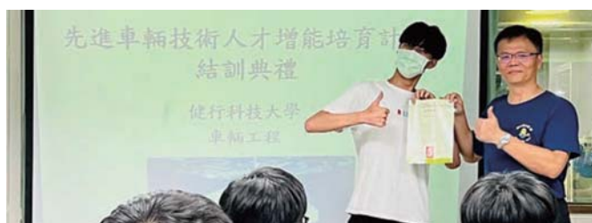
汽車修護增能培育輔導活動