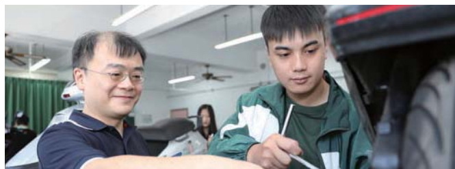
機車修護乙級檢定實習