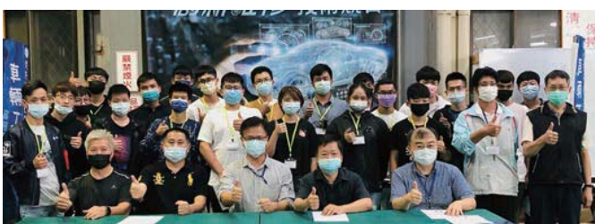
全國創新維修技術競賽合照