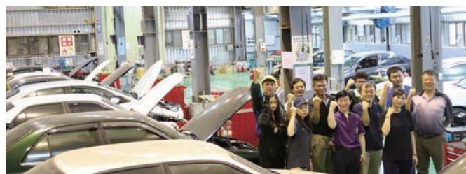
汽車修護乙級檢定場地與師資群