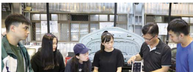
汽車智慧診斷系統實習